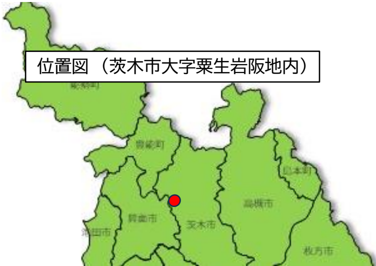
位置図（茨木市大字粟生岩阪地内）