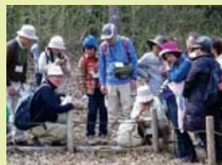
ネイチャーガイド