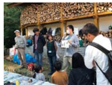
イベント実施の様子

大阪府民の森パークレンジャーになるには、パークレンジャー養成講座を受講してNPO法人日本パークレンジャー協会に入会して下さい。 講座では、自然の見方や考え方、パークレンジャーと歩いて園地を知るハイキング、野外活動での安全管理や救急法、インタープリテーションや催し企画の仕方など、ボランティア活動の実践について楽しみながら学びます。 講座の講師は森林インストラクターや経験豊富なパークレンジャーが指導します。