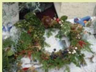
ネイチャークラフト

森づくり隊による大阪府民の森での森林保全活動。シイタケ栽培等の森の資源利用など。