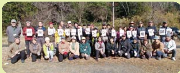
大阪府民の森パークレンジャー 30 周年